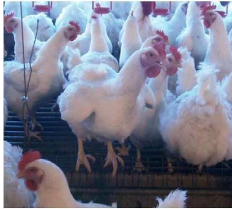
Figura 2: Ave mostrando estrés por calor después de comer

Es importante que los programas de manejo funcionen correctamente para enfrentarse a cualquier problema debido al estrés de calor (véase la sección de prevención).